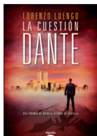
2013 Lorenzo Luengo La cuestión Dante