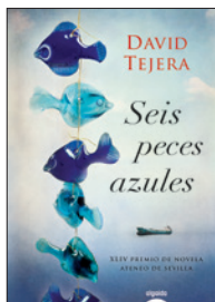
2012 David Tejera Seis peces azules